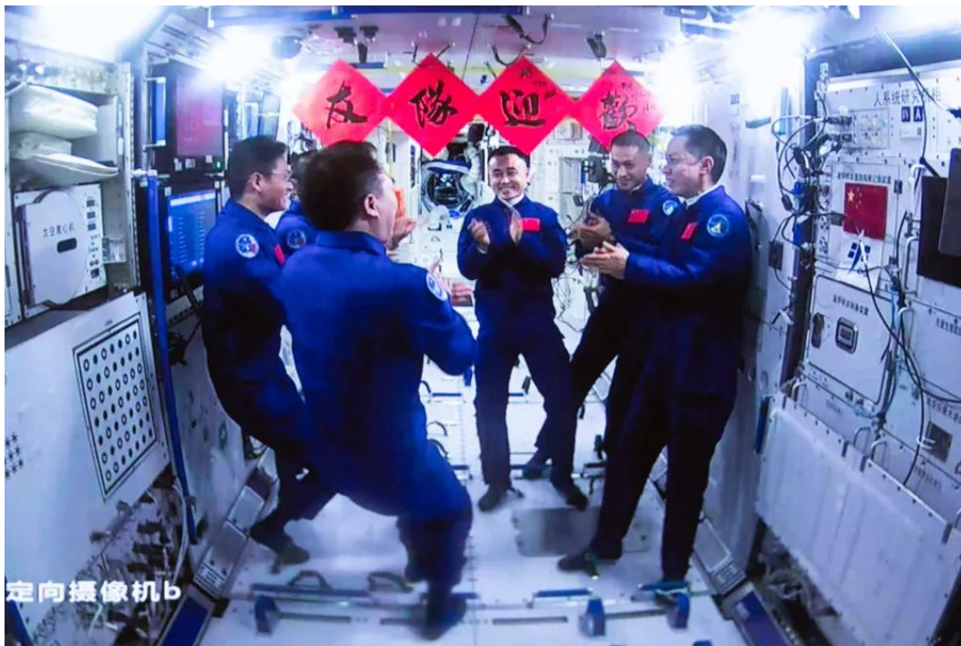
在北京航天飞行控制中心拍摄的神舟十六号航天员乘组与神舟十七号航天员乘组交流的画面（2023年10月26日摄）。

（六）“大国工匠是我们中华民族大厦的基石、栋梁。”习近平总书记饱含深情的一番话，充满着对劳动者的敬意，更揭示了人才对于国家发展的重要意义。人是生产力中最活跃的因素，也是最具有决定性的力量。基于对人民群众历史主体地位的深刻认识，马克思主义经典作家鲜明提出了“主要生产力，即人本身”的观点。推动高质量发展，人才资源是第一资源，创新驱动本质是人才驱动。发展新质生产力，归根到底要靠人才，人才越多越好，本事越大越好。